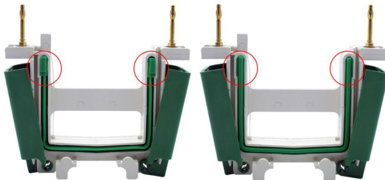
图2. 碧云天、Bio-Rad等公司的电泳槽U型硅橡胶密封条的突起结构图。由于碧云天的BeyoGel™ Elite PAGE预制胶的该部位是平的，使其兼容几乎所有厂家的小型胶电泳槽，所以电泳时须将具有突起结构的硅橡胶密封条(左图)取出后反过来安装(右图)，使其没有突起的平滑面朝外，从而防止漏液。